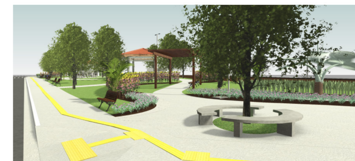
6 Vista 3D - Render 04 SEM ESCALA