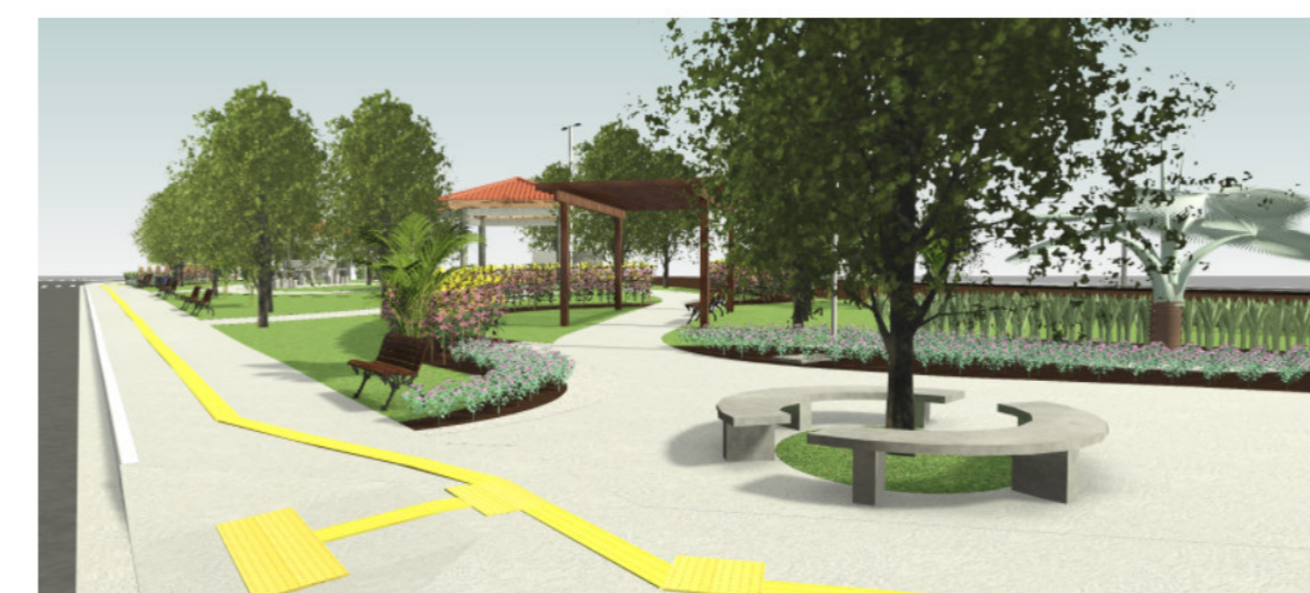
6 Vista 3D - Render 04 SEM ESCALA