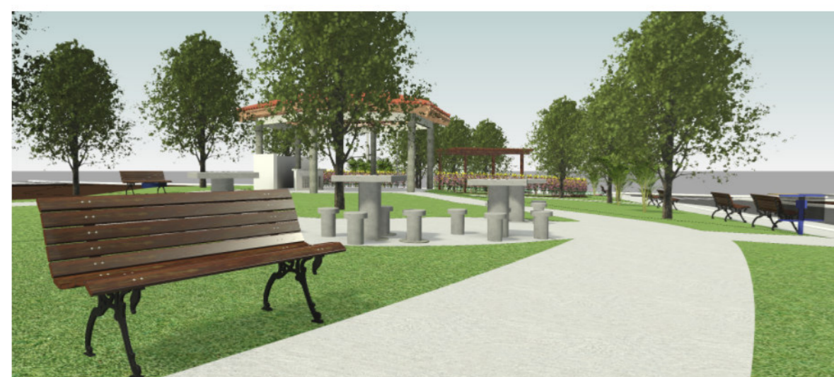
3 Vista 3D - Render 01 SEM ESCALA