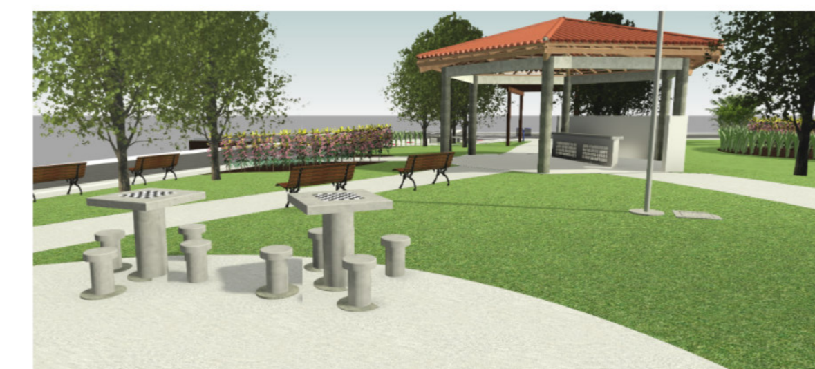
5 Vista 3D - Render 03 SEM ESCALA