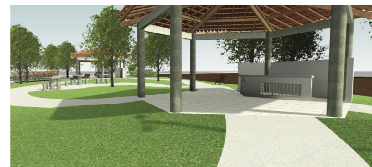
4 Vista 3D - Render 02 SEM ESCALA