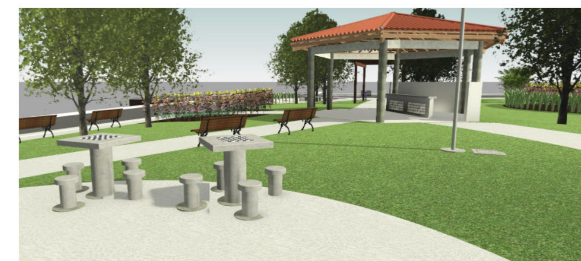
5 Vista 3D - Render 03 SEM ESCALA