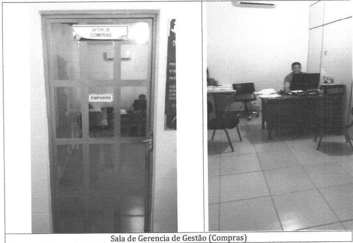
Sala de Gerencia de Gestão (Compras)