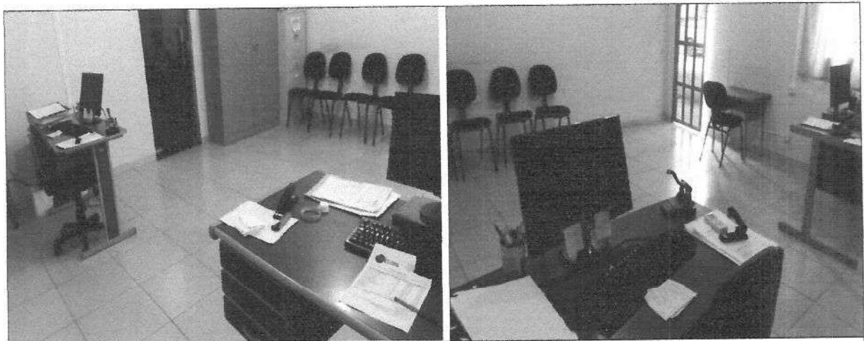
Sala de licitações e contratos